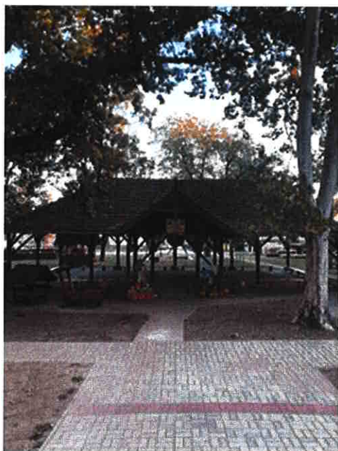
Őszi díszben- 2025.